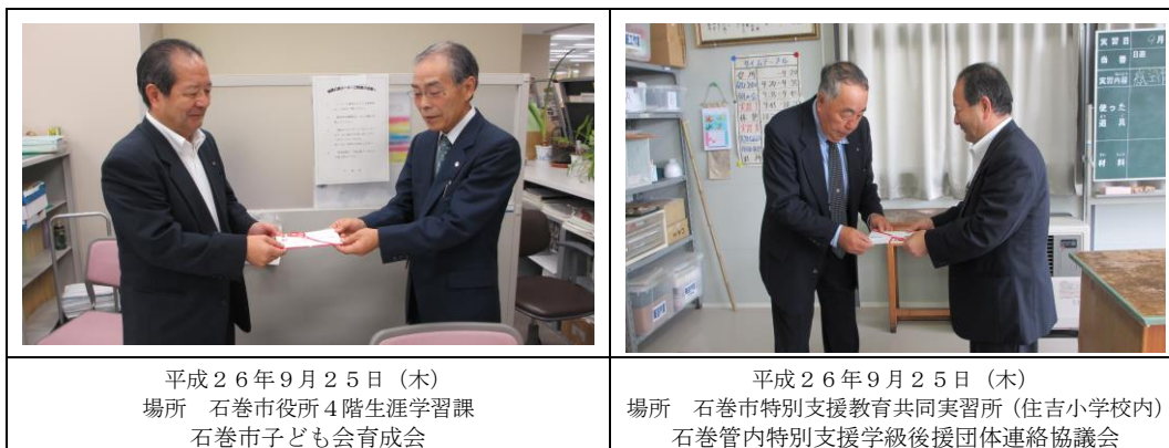
平成26年9月25日（木） 場所 石巻市役所4階生涯学習課 石巻市子ども会育成会